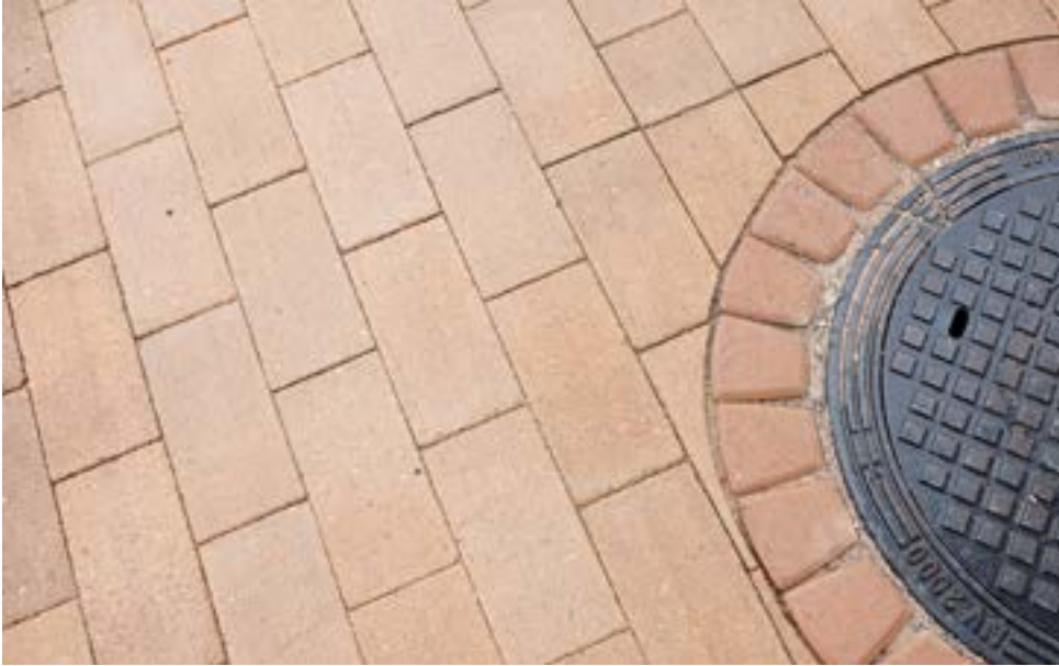
Saunalahden koulu, YIT Infrapalvelut Oy