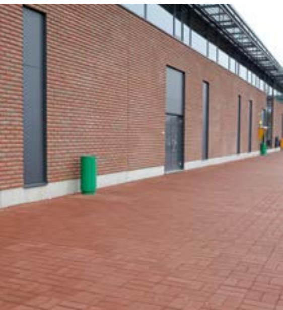
Halikon Prisma, ISS Proko Oy