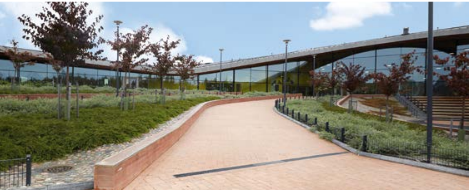
Saunalahden koulu, YIT Infrapalvelut Oy

Voittajaksi nousi Saunalahden koulun piha-alue toteutuksen, erinomaisen laadun sekä jo suunnittelussa huomioitujen kunnossapidon ansiosta. Alue on toteutettu ammattitaidolla ja työn jälki on erinomaista. Materiaali- ja kasvivalinnat ovat paikkaan sopivia ja onnistuneita. Kilpailun tuomaristossa olivat edustettuina Rakennustuoteteollisuus RTT:n, Puutarhaliiton, Kiviteollisuusliiton, Viherympäristöliiton, Suomen Maisema-arkkitehtiliiton, Suomen Arkkitehtiliiton, Suomen Kuntaliiton, Ympäristöministeriön ja lehdistön edustajat.