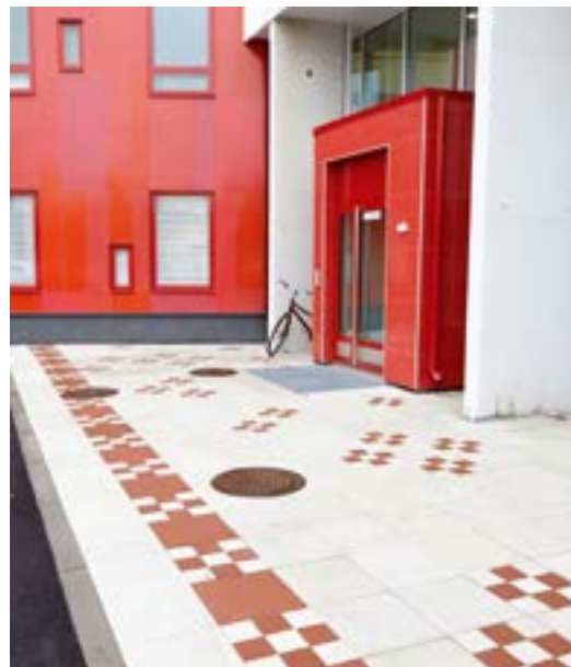
HYVON Salo, NCC Rakennus Oy