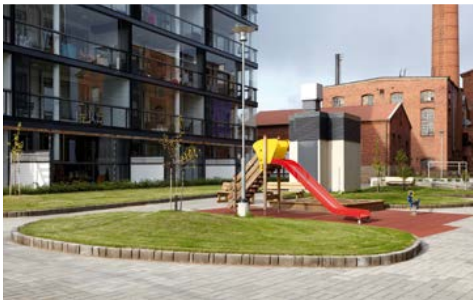
AS OY Puuvilla, YIT Rakennus Oy