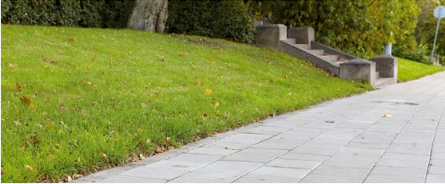
Itäinen Rautakatu, Turun kaupunki