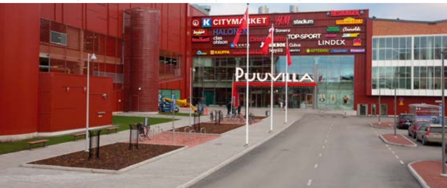
Porin Puuvilla, Skanska Talonrakennus Oy