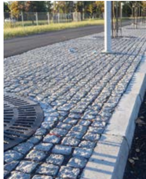
Porin Uimahalli, Skanska Talonrakennus Oy