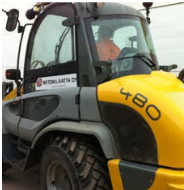
|| Kaivin ja Kallio Oy, kiertoliittymä, Turku