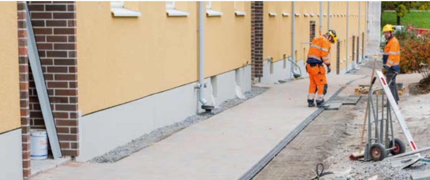
TVT Asunnot Oy, YIT Rakennus Oy