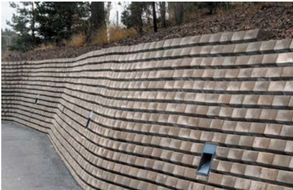
YIT:n konttori, YIT Rakennus Oy