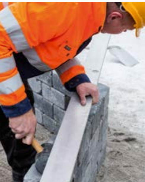
AS OY Puutarhakatu, PEAB Oy