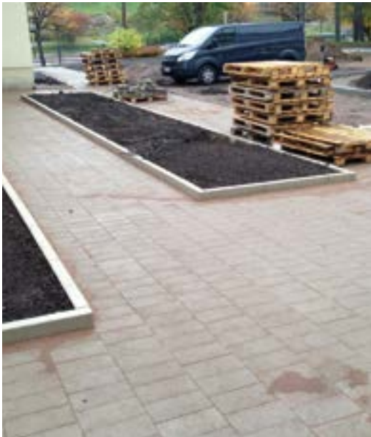
Mannerheimintie 166, Viherpiha Oy