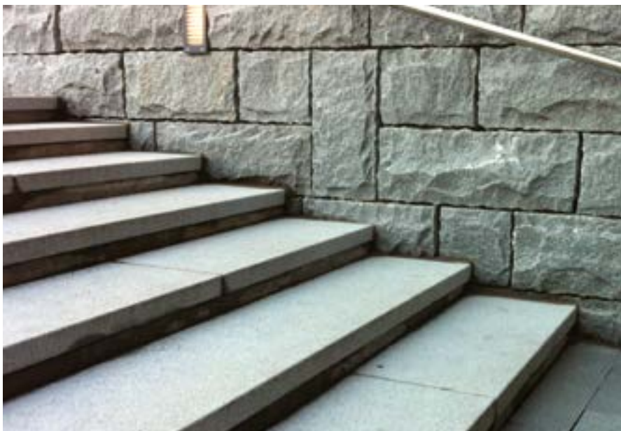
AS Oy Kupittaaan Haikara, NCC Rakennus Oy