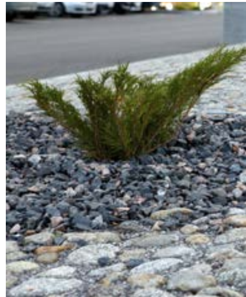
Keskusautohalli, NCC Rakennus Oy