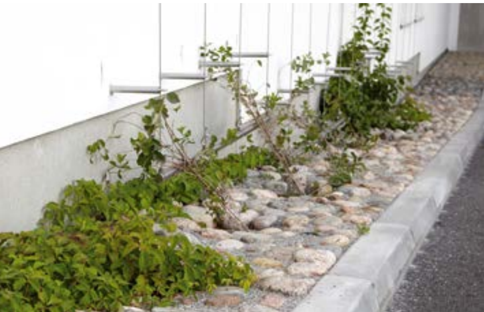
TYKS, YIT Rakennus Oy