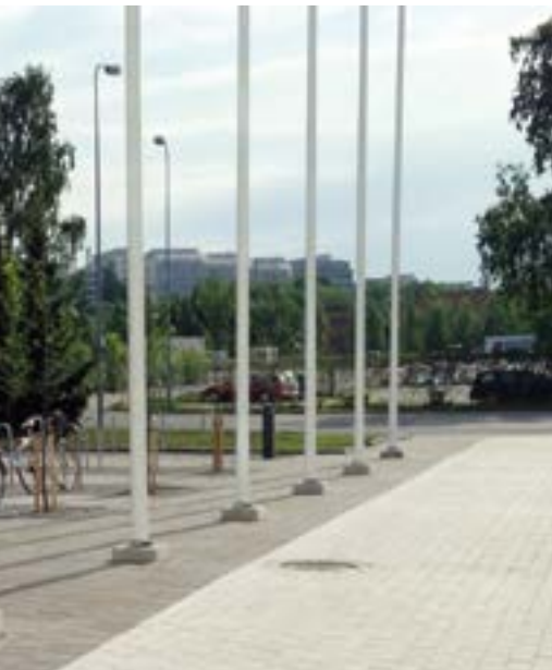
Port Center, Hartela Oy