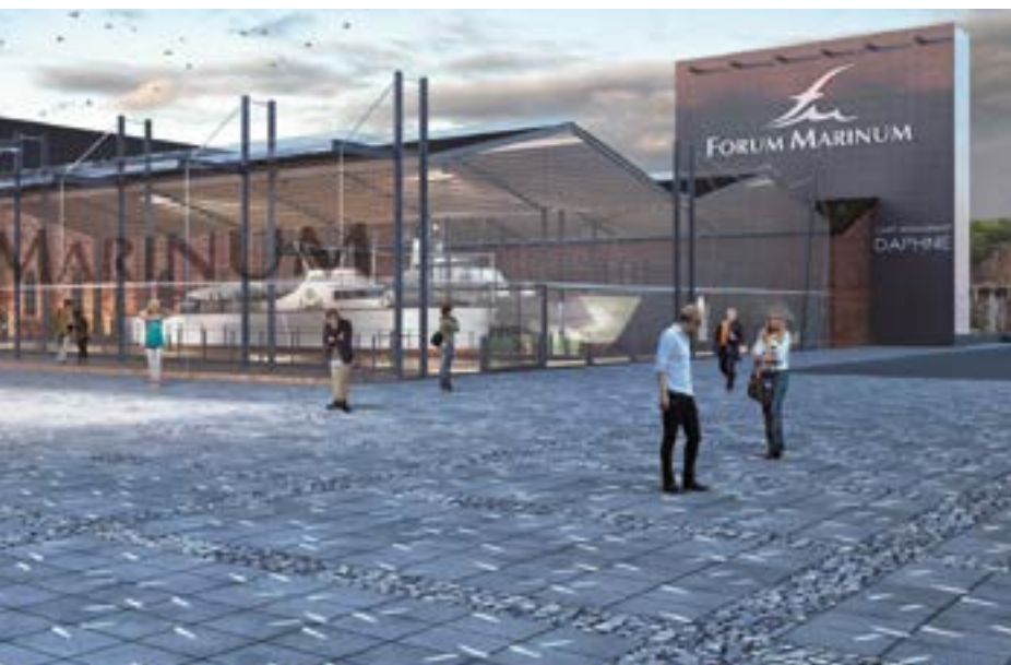
Saaristomeren Aukio, Forum Marinum säätii