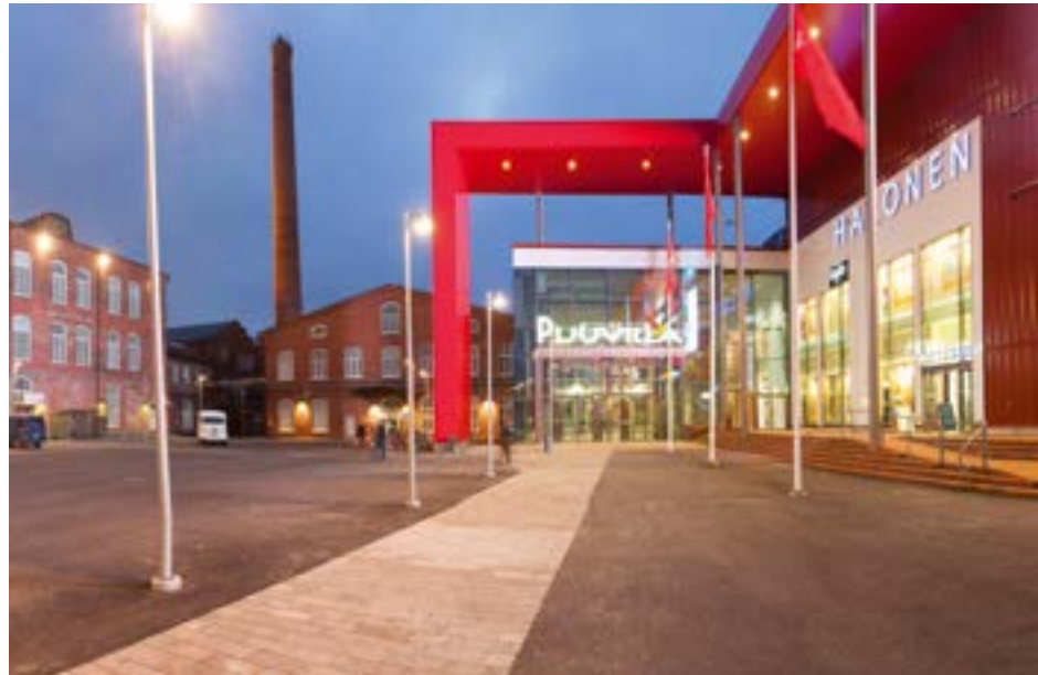
Porin Puuvilla, Skanska Talonrakennus Oy